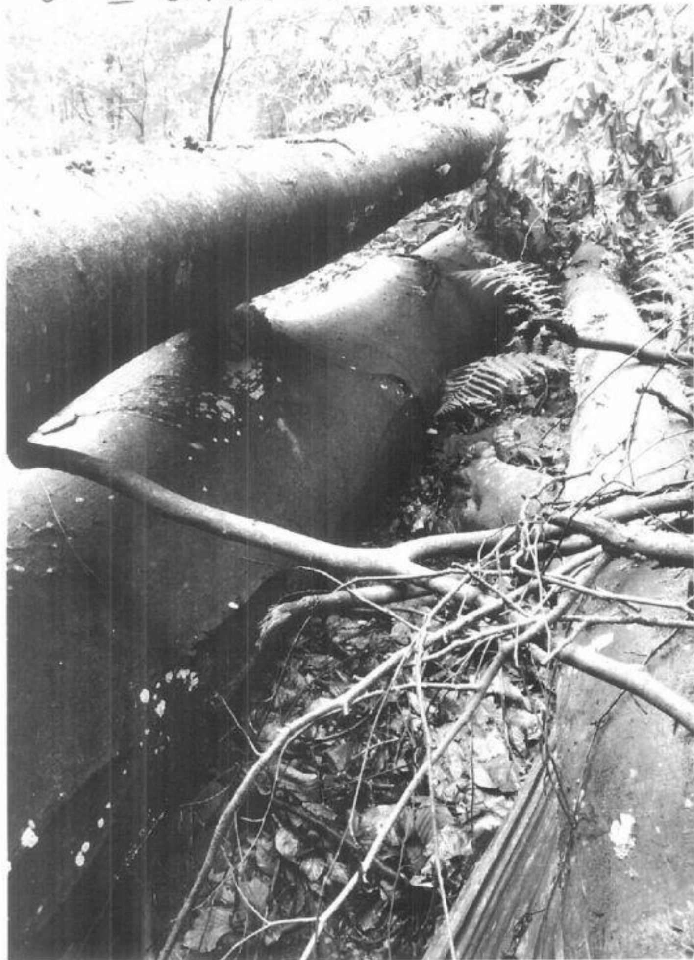
UP VI Govora ua 56A