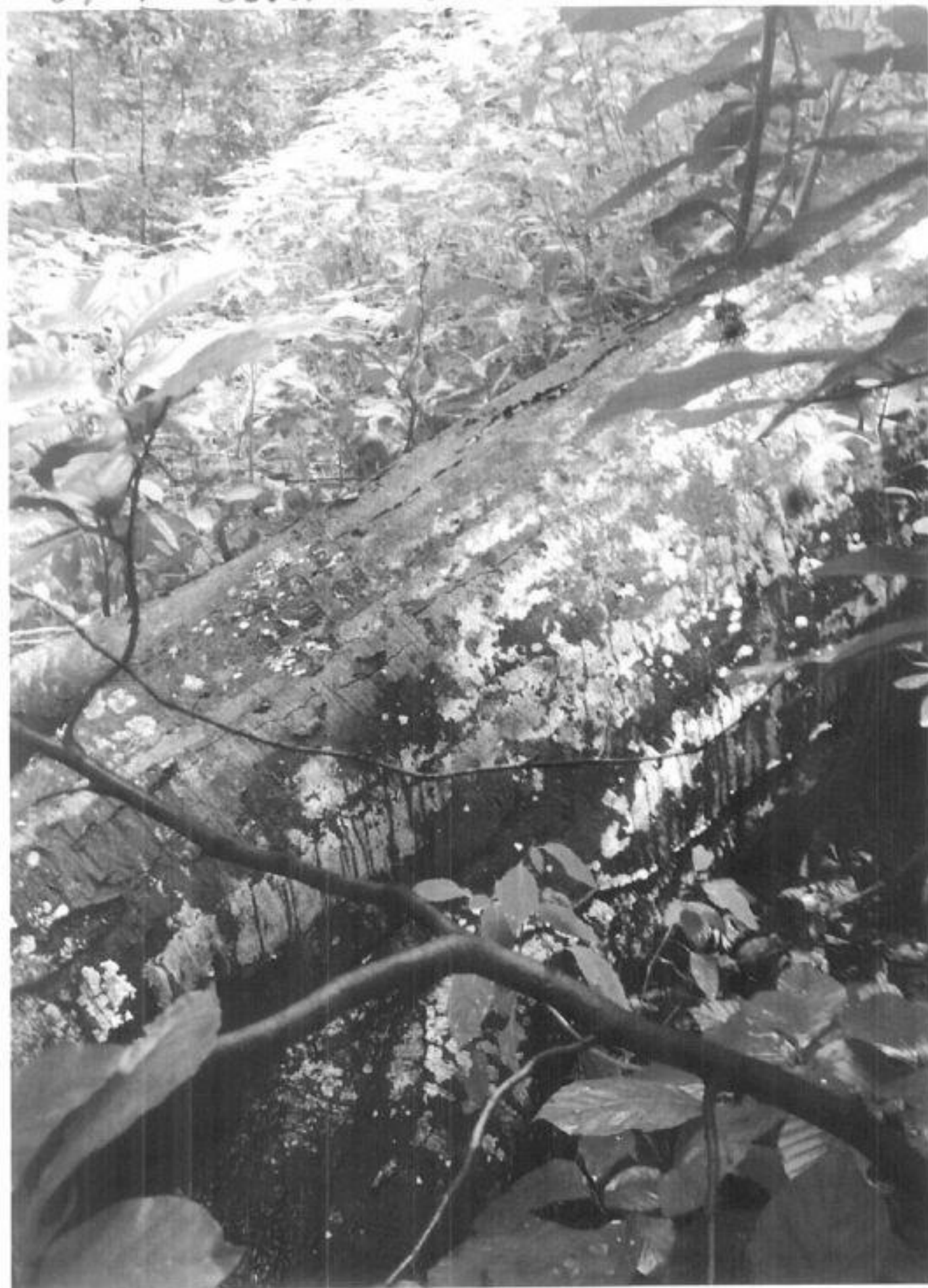
UP VI Goyora 56 D